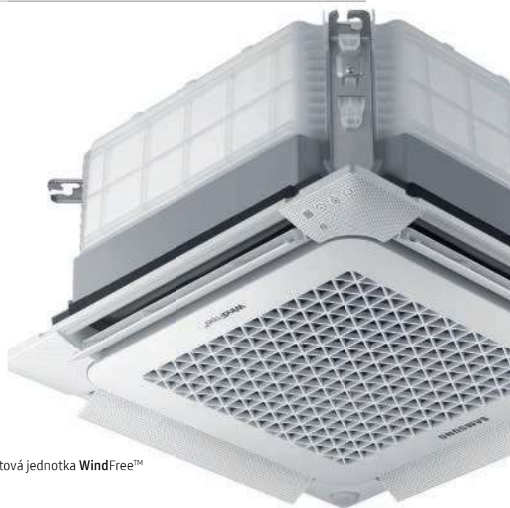
Vnútorná kazetová jednotka WindFree™